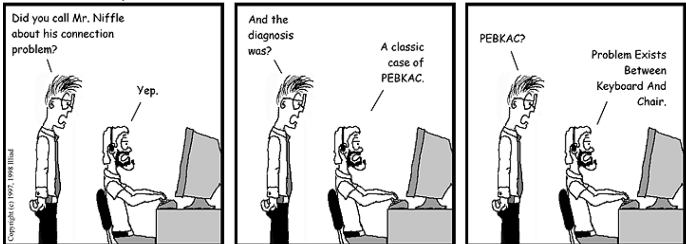
USER FRIENDLY by Illiad